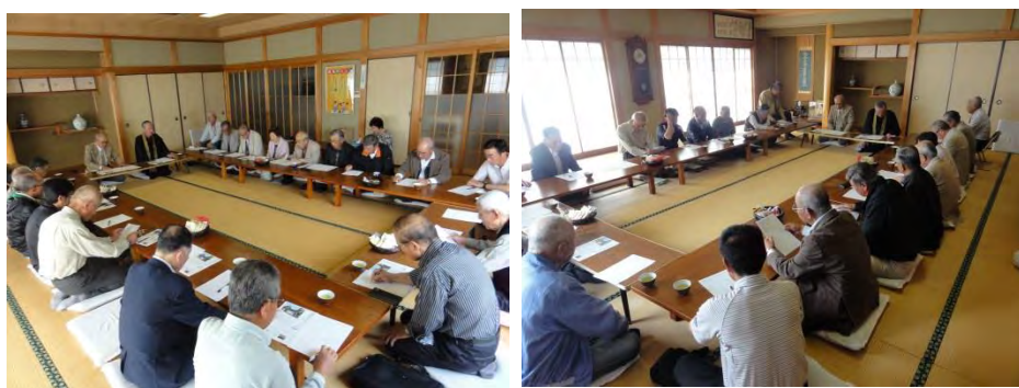
世話人様・各地区法要委員様

この大法要を門信徒様・寺族が一体となって準備をすすめ、次代に浄土真宗の「み教え」が伝わることを願いに、法要円成を目指して、共に歩んでまいりましょう。